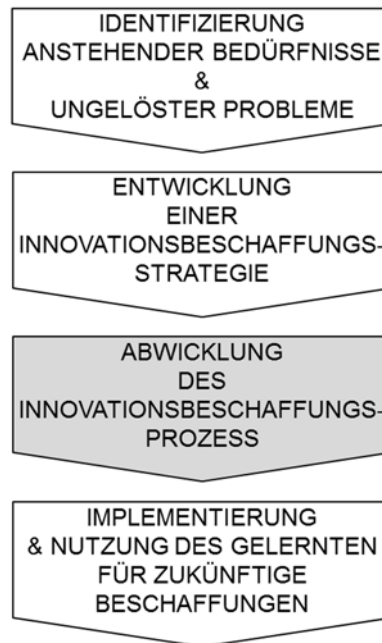
Abbildung 1. Idealtypischer Innovationsbeschaffungs-Ablauf in einer öffentlichen Einrichtung