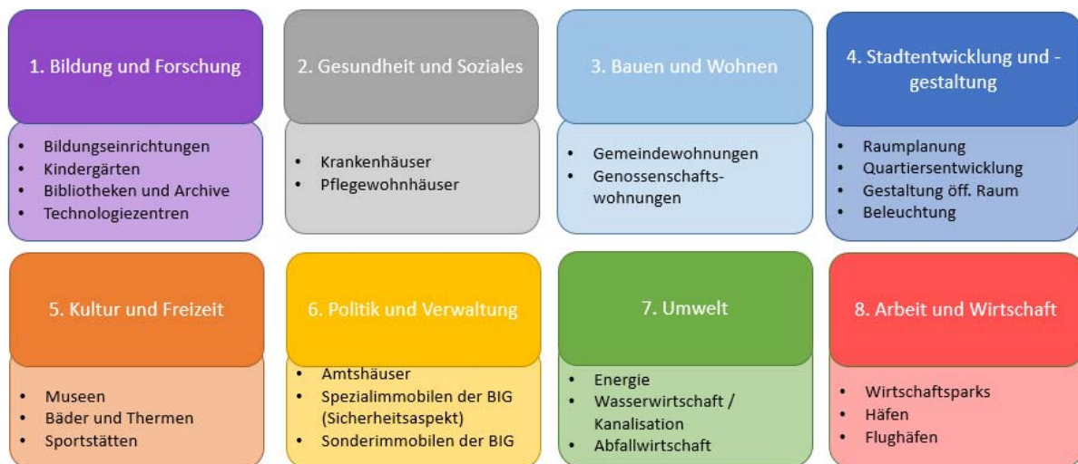
Abbildung 3. Für das Projekt relevante, städtische Tätigkeitsbereiche.

Die acht relevanten Tätigkeitsbereiche stellen die Leitplanken für die weitere Recherche nach möglichen Anwendungsfeldern von innovationsfördernder öffentlicher Beschaffung im Gebäudebereich, für Stadtquartiere und für Smart Cities dar. Aufgrund der spezifischen Themenwahl des Projekts wurden dafür insbesondere innovative Gebäudetechnologien, urbane Energiesysteme